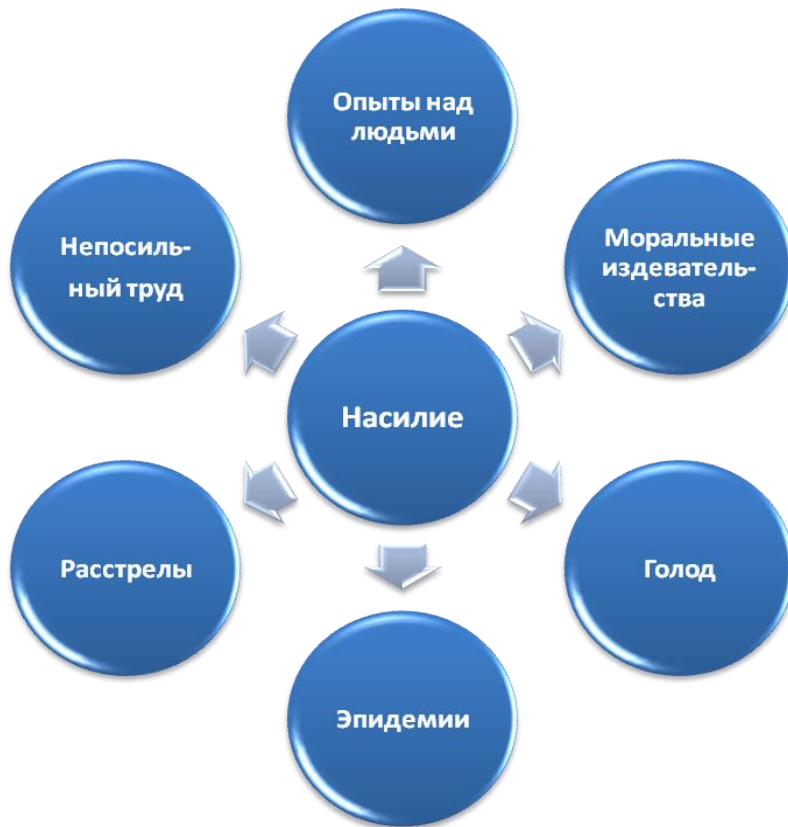
Схема № 2