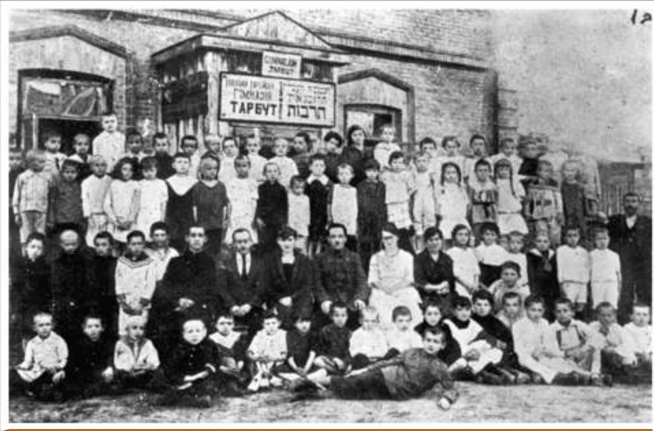
На довоєнному фото - рівненська єврейська гімназія "Тарбут"